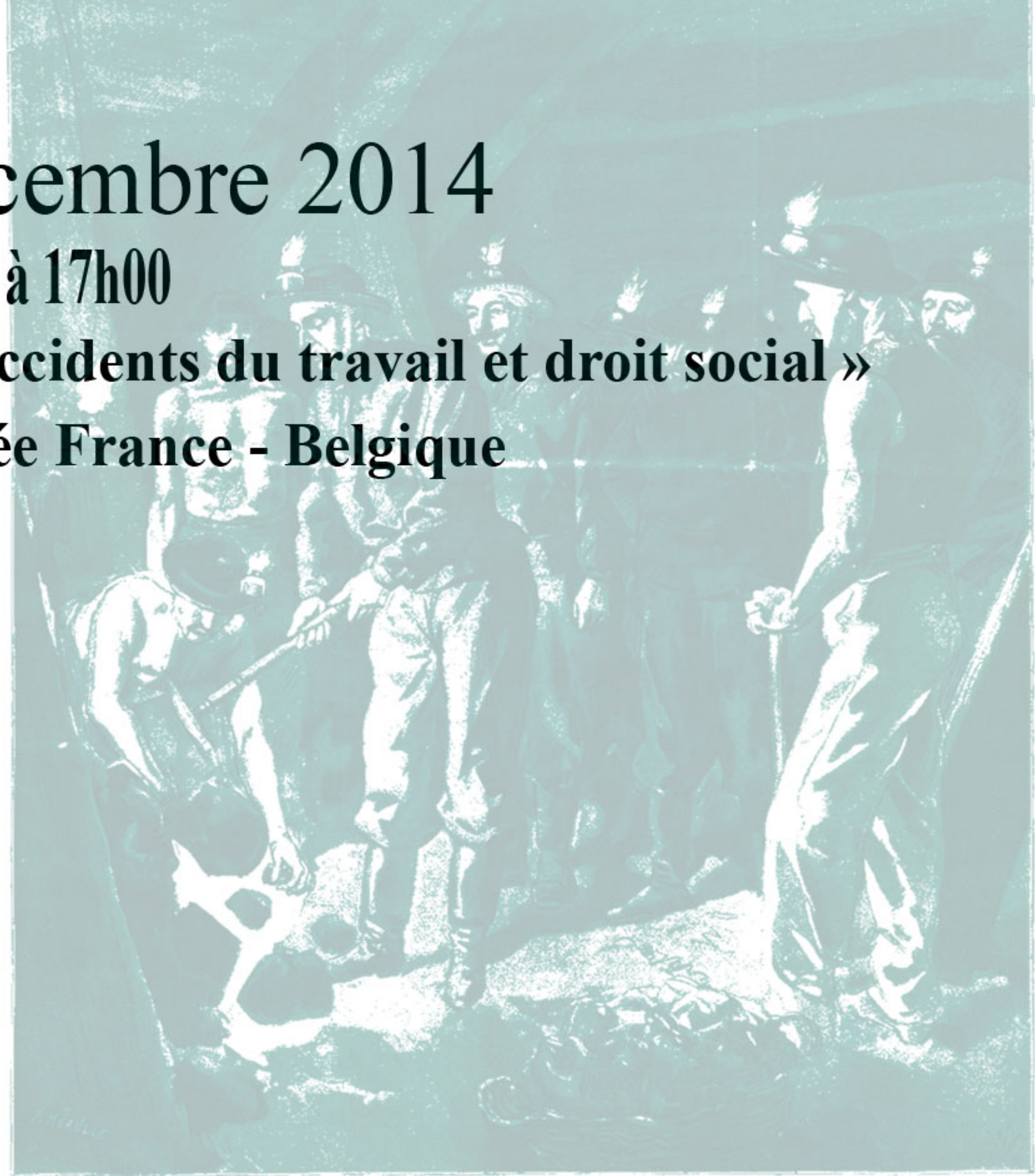
Le Président de la République aux mines de Lens